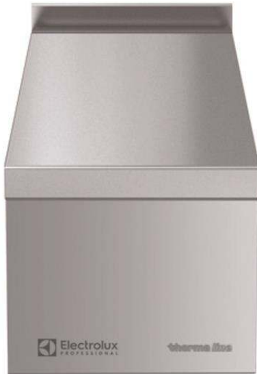
588562 (MBNABBCOOO) thermaline 85 - 300 mm CLOSED WORK TOP, ISIDE OPERATION WITH BACKSPLASH